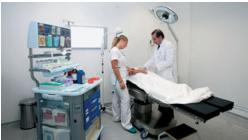
📍 Sala de pequena cirurgia