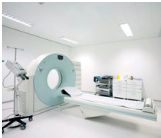
▶ O Centro dispõe de salas dedicadas à realização de exames especiais de diagnóstico de apoio às mais diversas especialidades, como a TAC

paredes e em algumas peças de mobiliário, aspectos destinados a criar mais conforto, comodidade e bem-estar para profissionais e clientes.