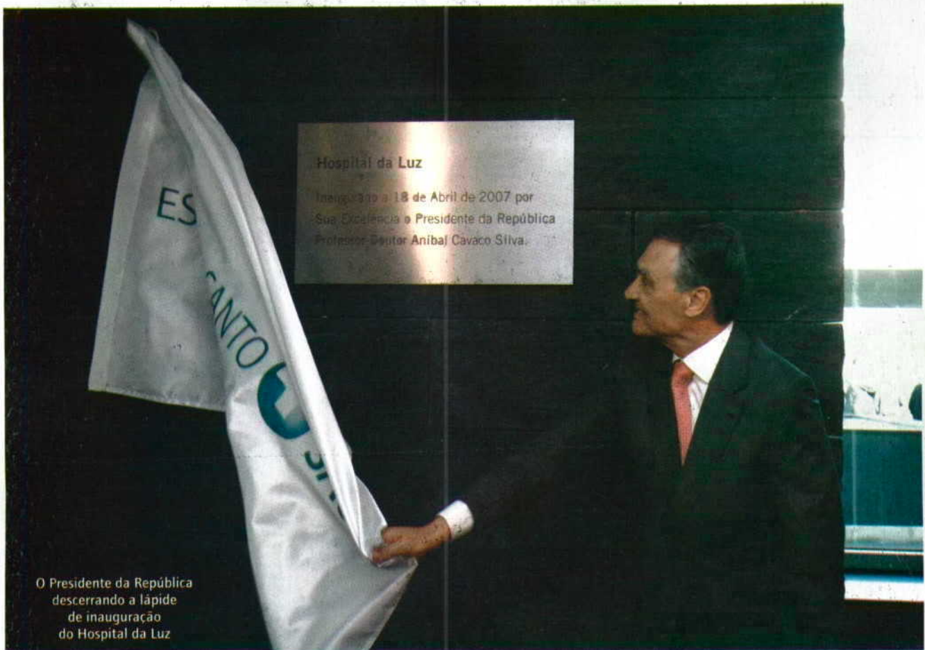
O Presidente da República descerrando a lápide de inauguração do Hospital da Luz

Hospital da Luz Inaugurado a 18 de Abril de 2007 por Sua Excelência o Presidente da República Professor Doutor Aníbal Cavaco Silva.