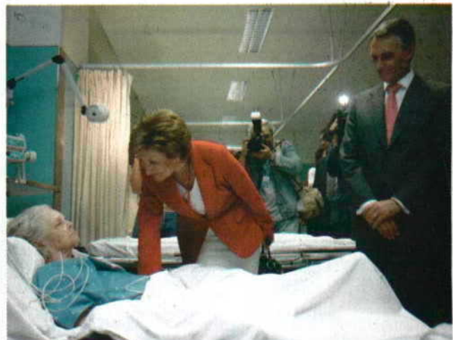
Maria e Aníbal Cavaco Silva atentos na visita a uma das enfermarias

to, frisando que “não é todos os dias que se tem a honra de inaugurar um hospital em Portugal. O Hospital da Luz é moderno e tecnologicamente avançado”.