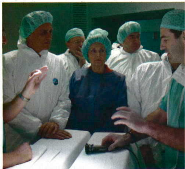
Durante a visita às instalações

Hospital da Luz Inaugurado a 18 de Abril de 2007 por Sua Excelência o Presidente da República Professor Doutor Aníbal Cavaco Silva.